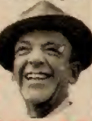
Fred Astaire, 28.12.

STEINBOCK: Endlich winkt Ihnen die längst verdiente Anerkennung. Schmieden Sie das Eisen solange es warm ist. Ein einziges Wort im rechten Augenblick ist besser als eine lange Rede zur verkehrten Zeit.